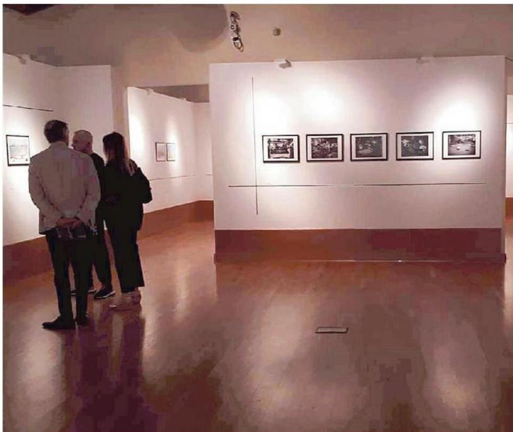
La mostra promossa dalla Fondazione Laviosa: in vetrina nei Granai di Villa Mimbelli